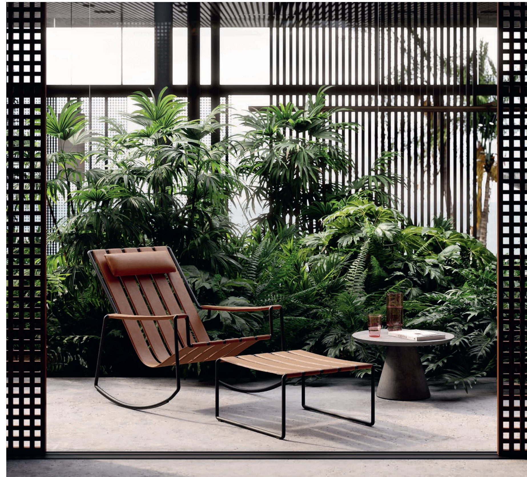
STRAPPY ROCKING CHAIR & FOOTREST - CONIX 60T SIDE TABLE