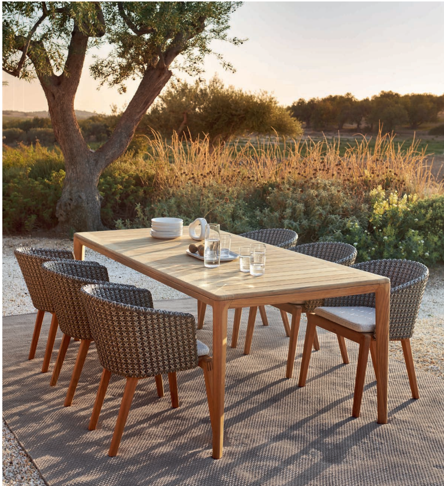
136 CALYPSO 55KK DINING CHAIRS - U-NITE 220 DINING TABLE - RUG 2535