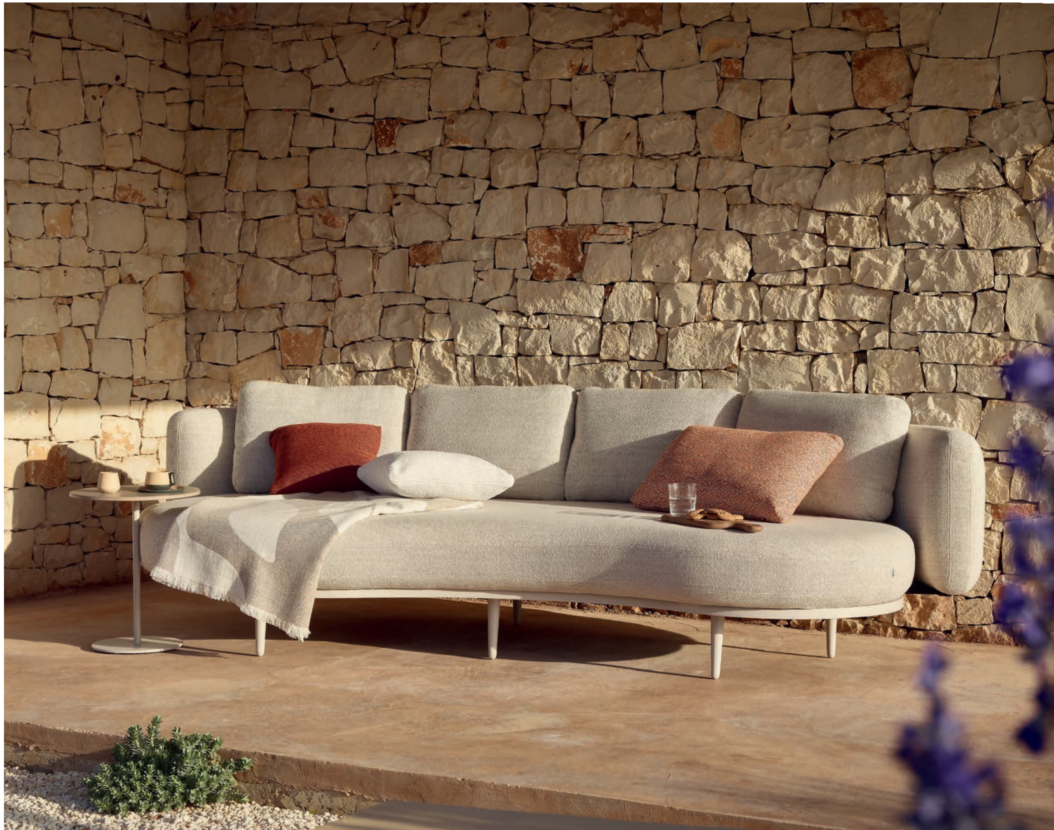
86 ORGANIX LOUNGE - BUTLER 40TXH SIDE TABLE