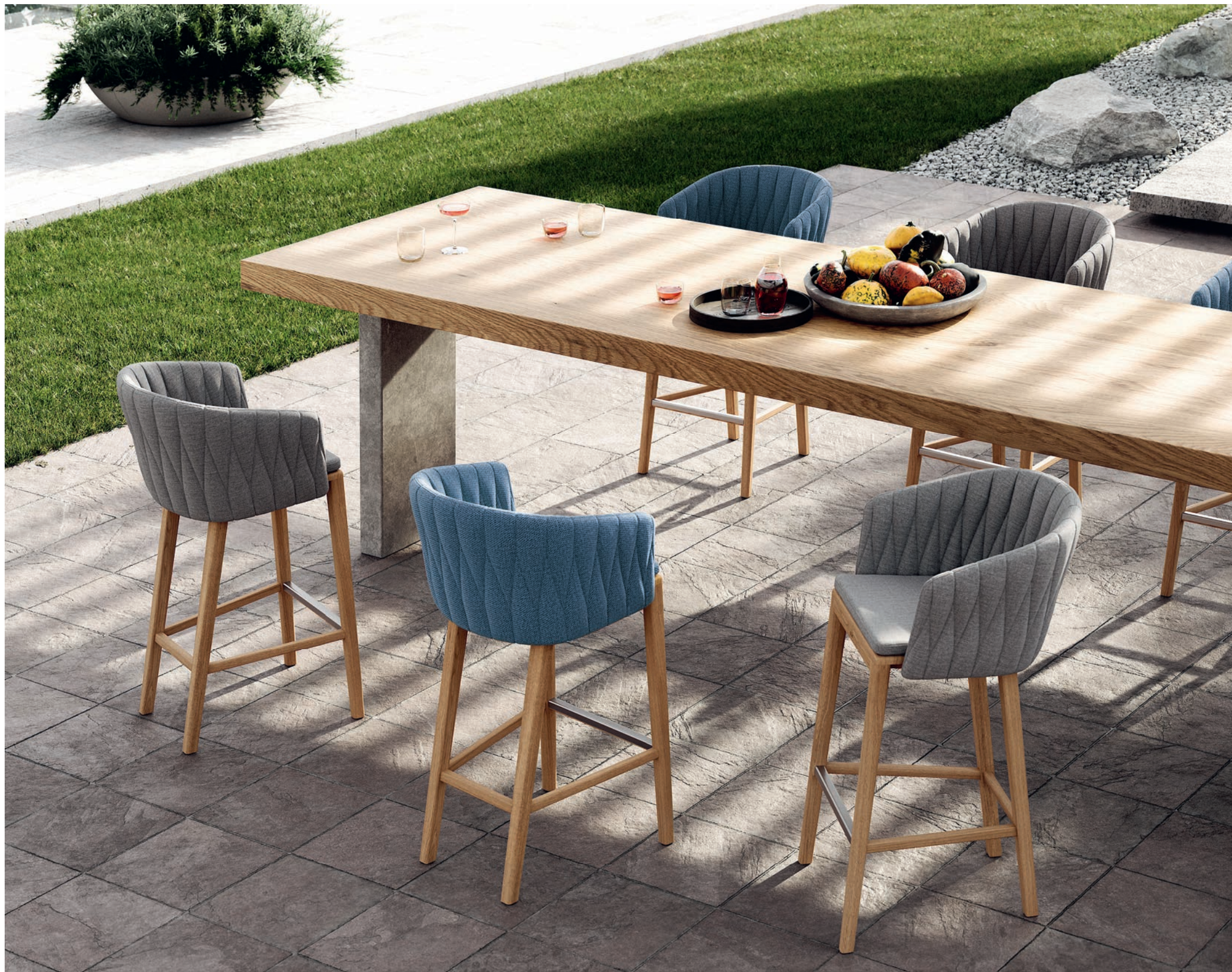
148 CALYPSO 43 BAR CHAIRS