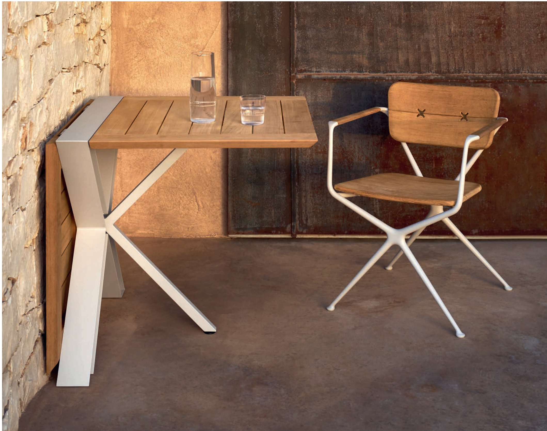
130 TRAVERSE 150F FOLDABLE TABLE - EXES 55W DINING CHAIR