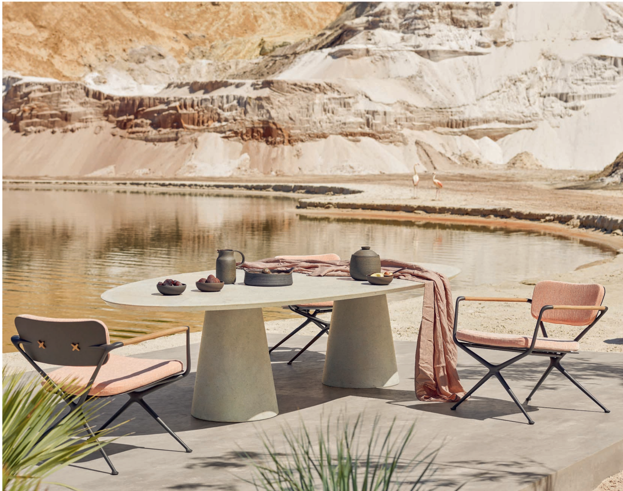
186 EXES 77 LOW CHAIRS - CONIX 3214 LOW DINING TABLE