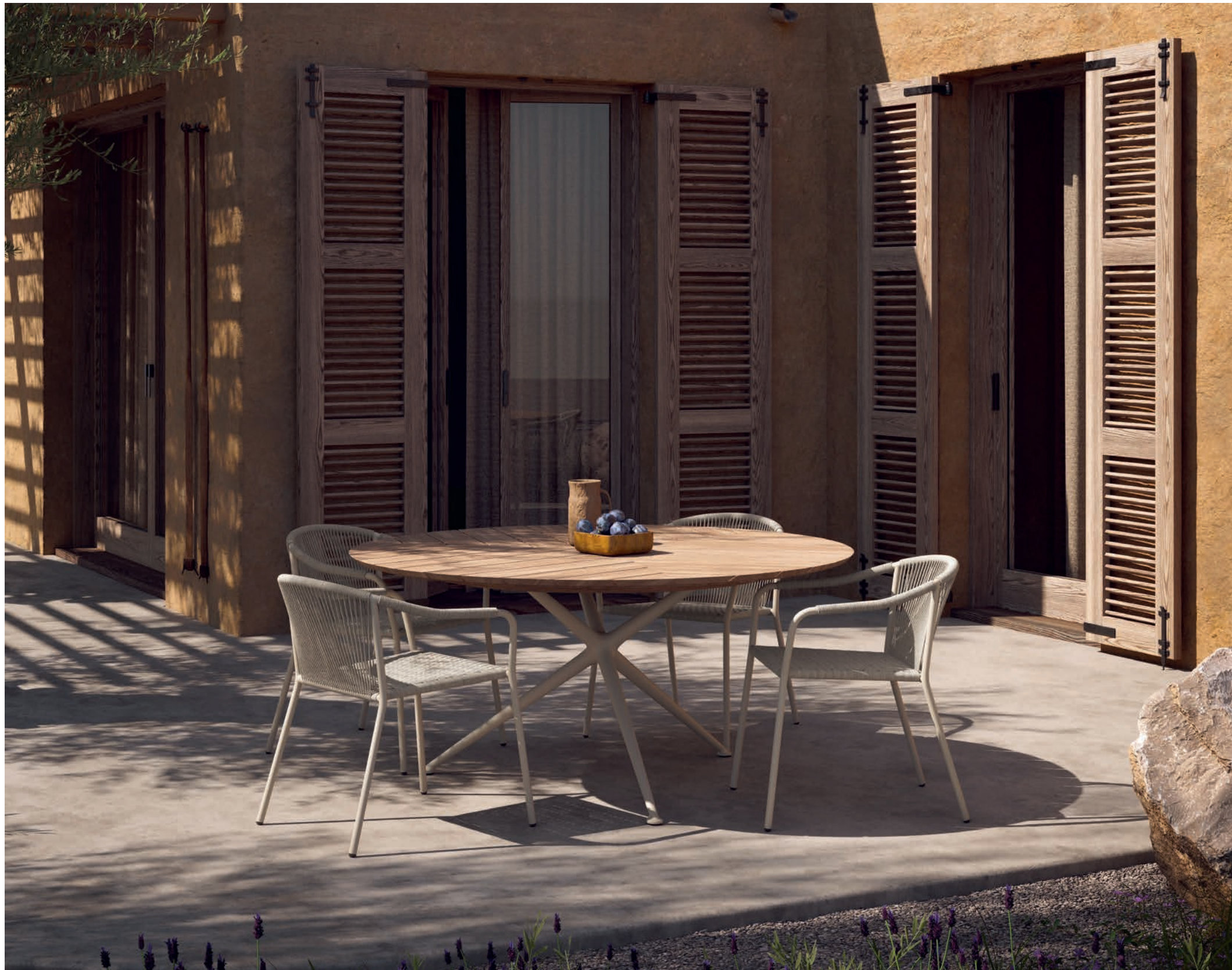
126 SAMBA 55 DINING CHAIRS - EXES 160 DINING TABLE