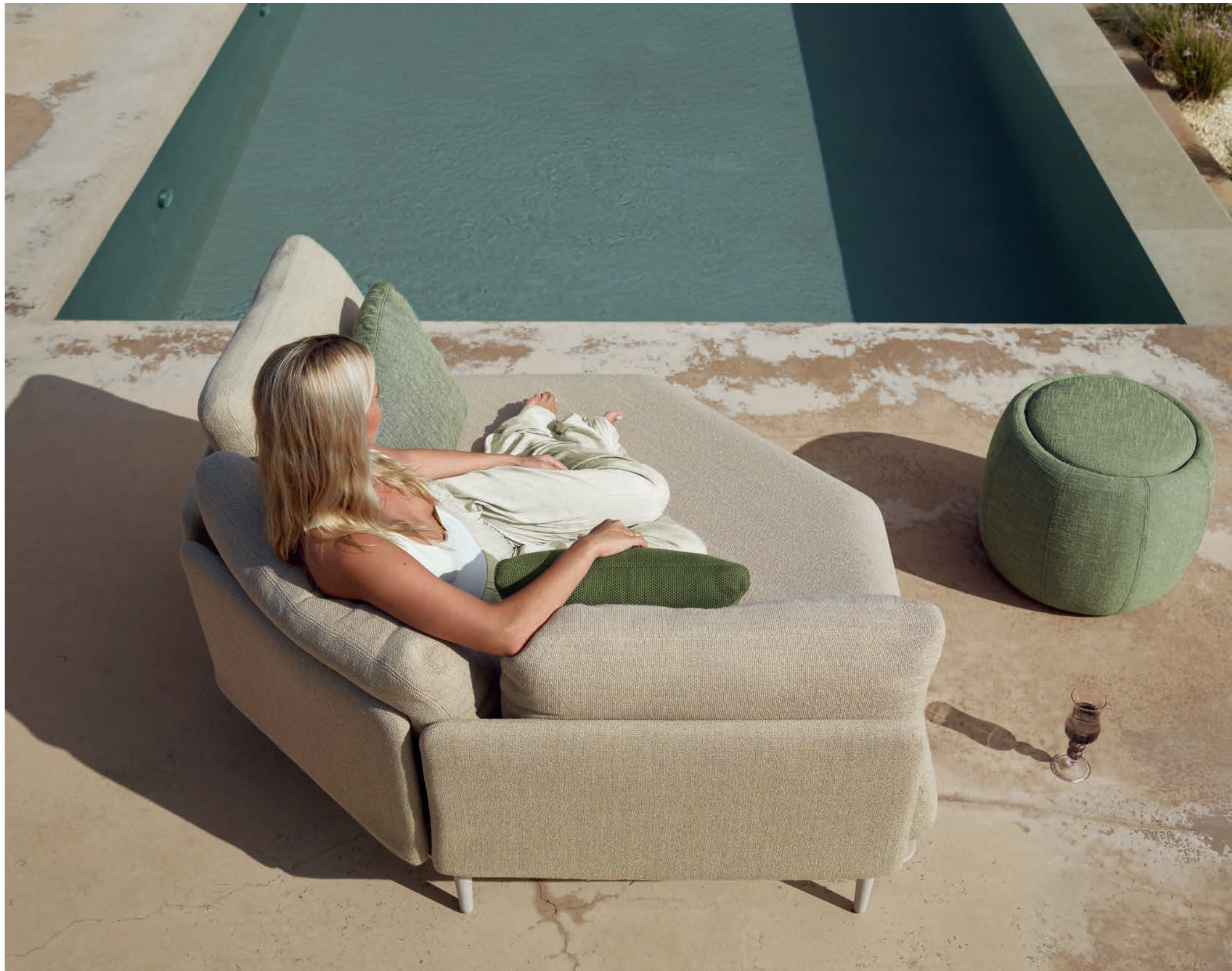
64 STYLETTO LOUNGE - TONO 50 POUF