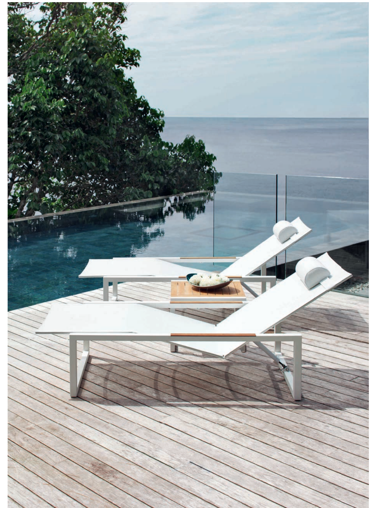
NINIX 195T LOUNGERS - NINIX 50 SIDE TABLE