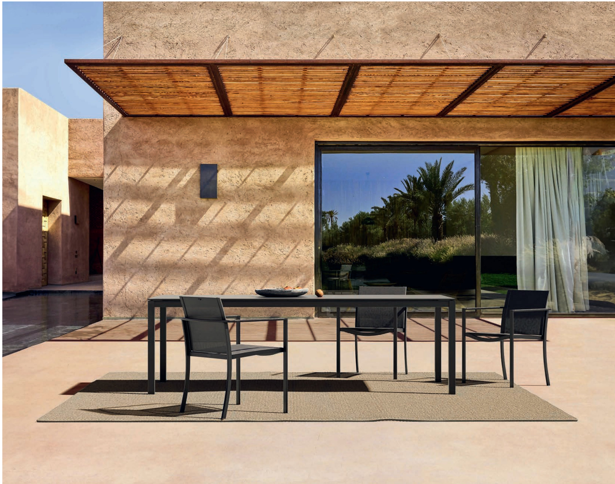
80 TABOELA 220 DINING TABLE - O-ZON 55T DINING CHAIRS - RUG 2535