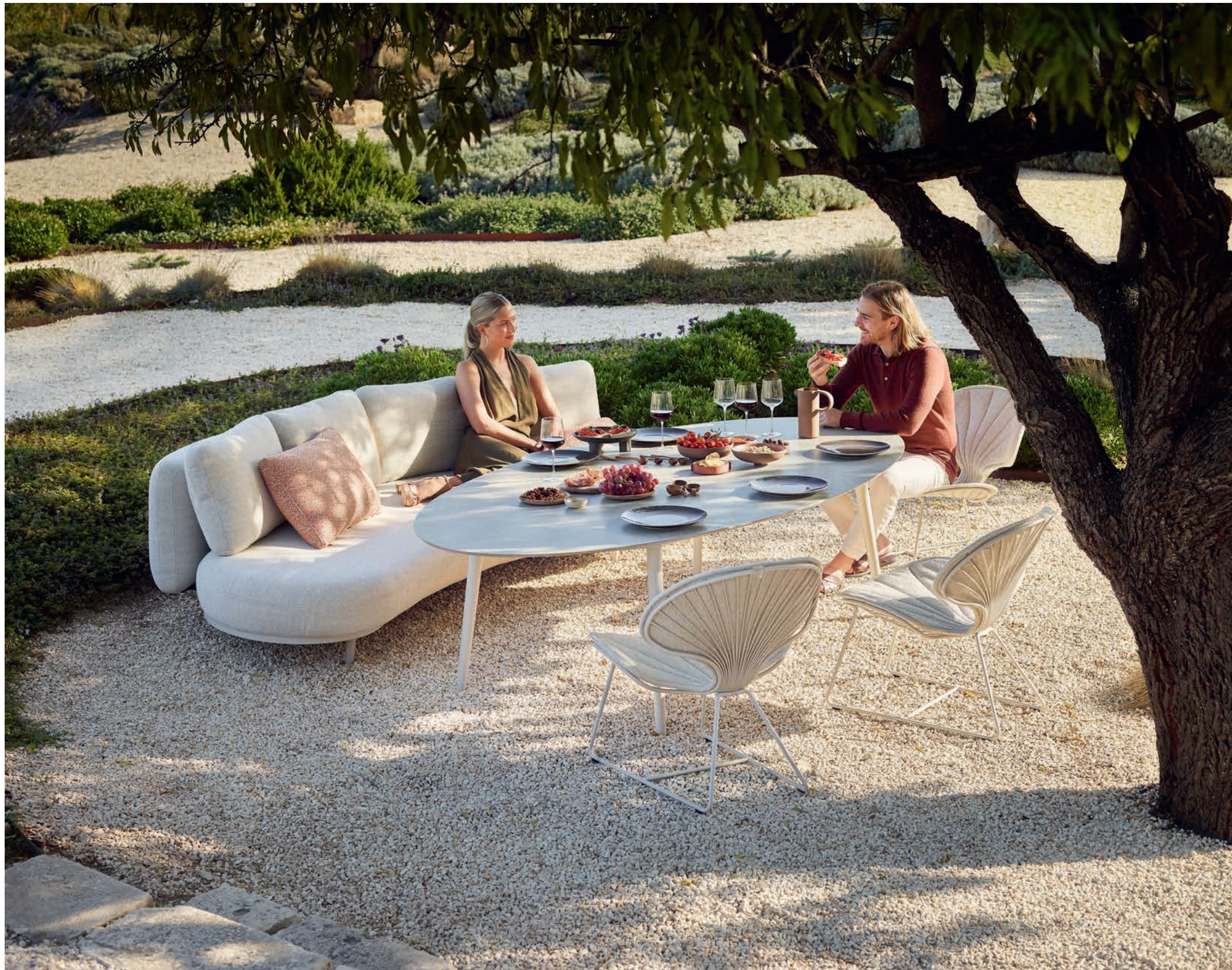
90 ORGANIX LOUNGE - STYLETTO 2513 LOW DINING TABLE - OSTREA 77 LOW CHAIRS