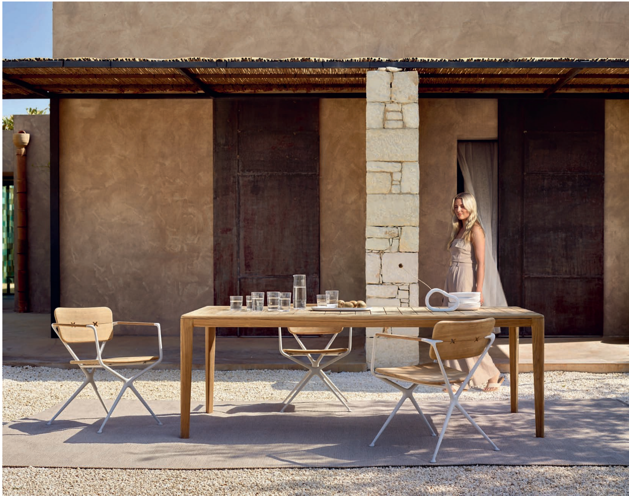
134 EXES 55W DINING CHAIRS - U-NITE 220 DINING TABLE - RUG 2543