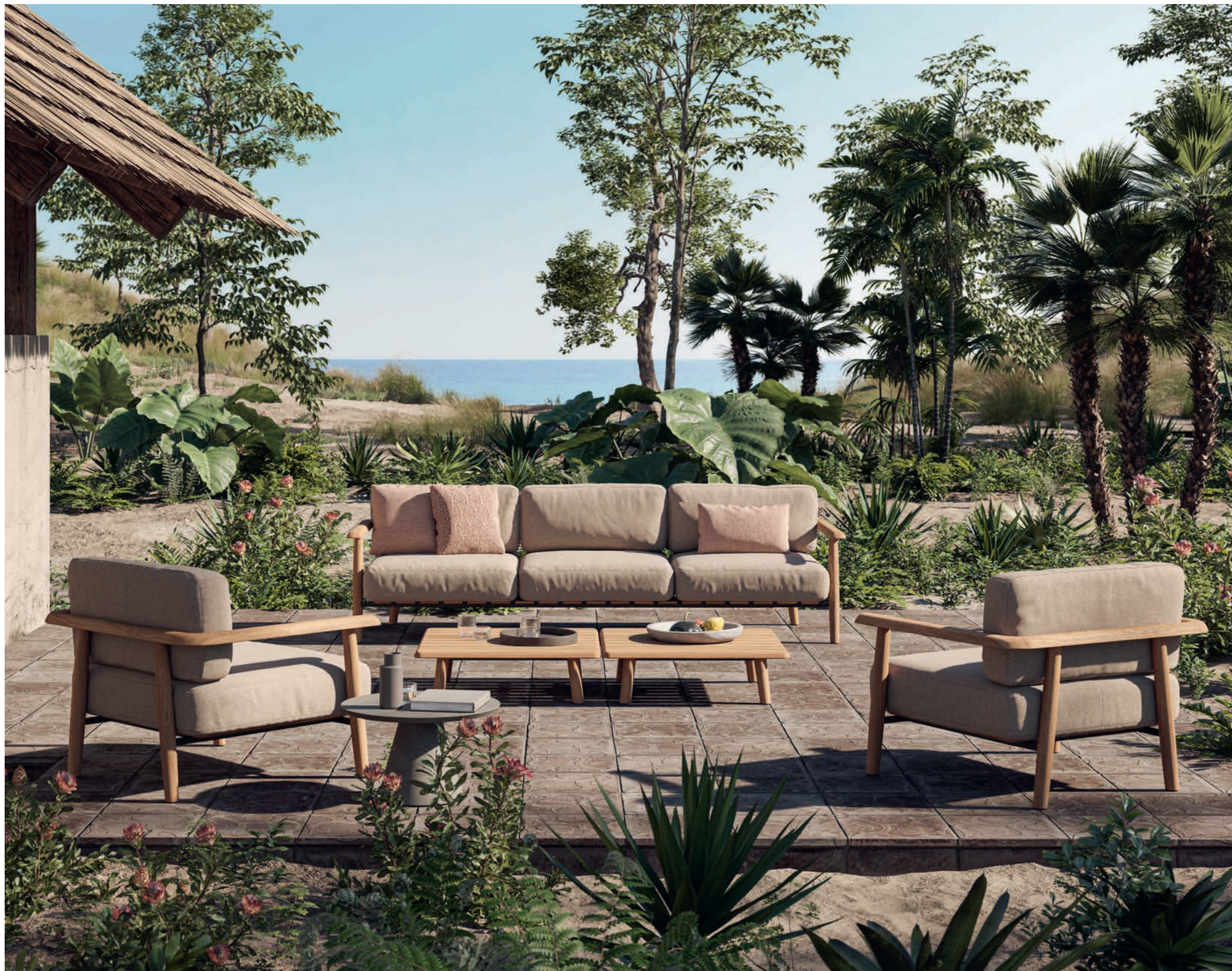
18 MAMBO LOUNGE - CONIX 60T SIDE TABLE