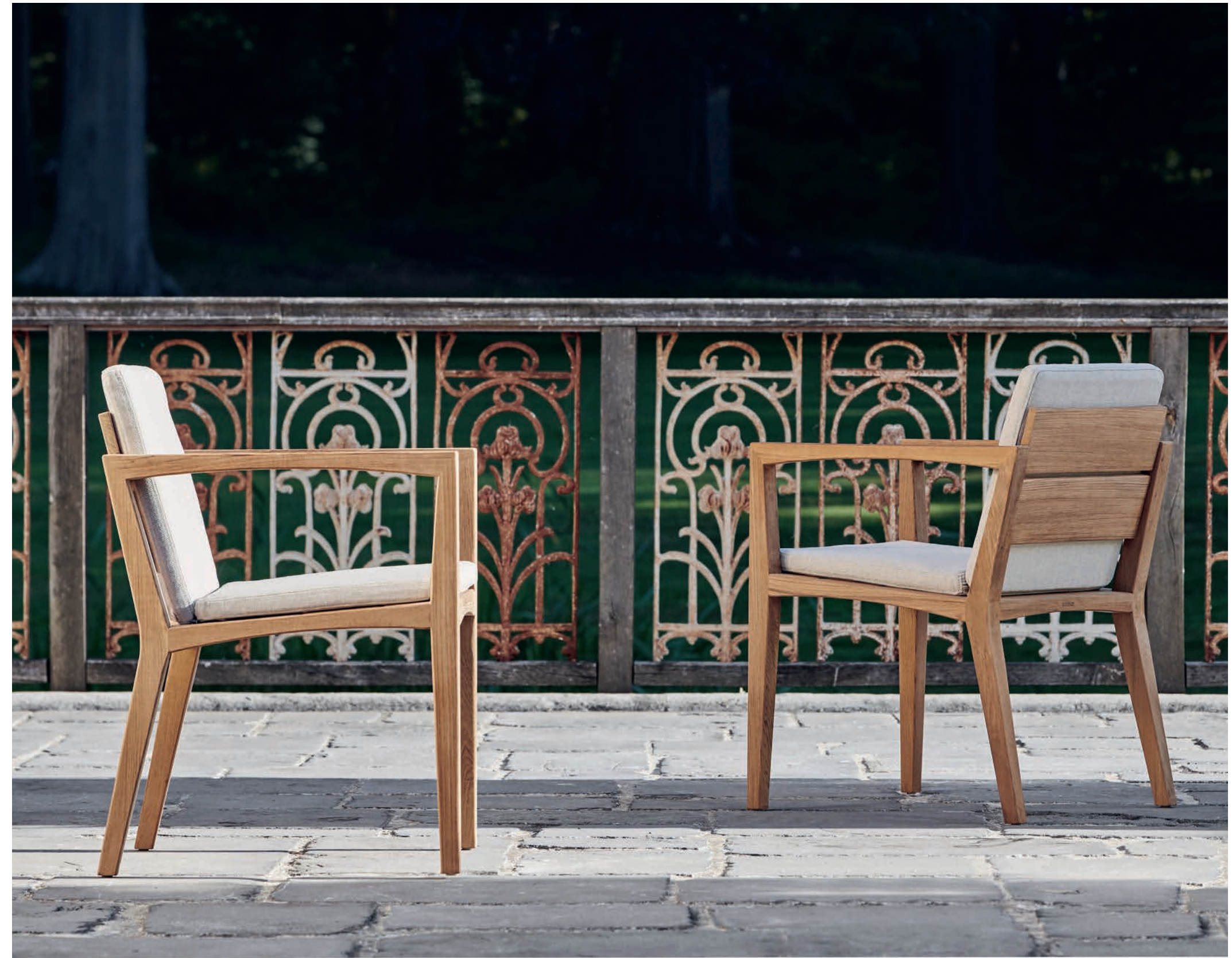
ZENHIT 55 DINING CHAIRS