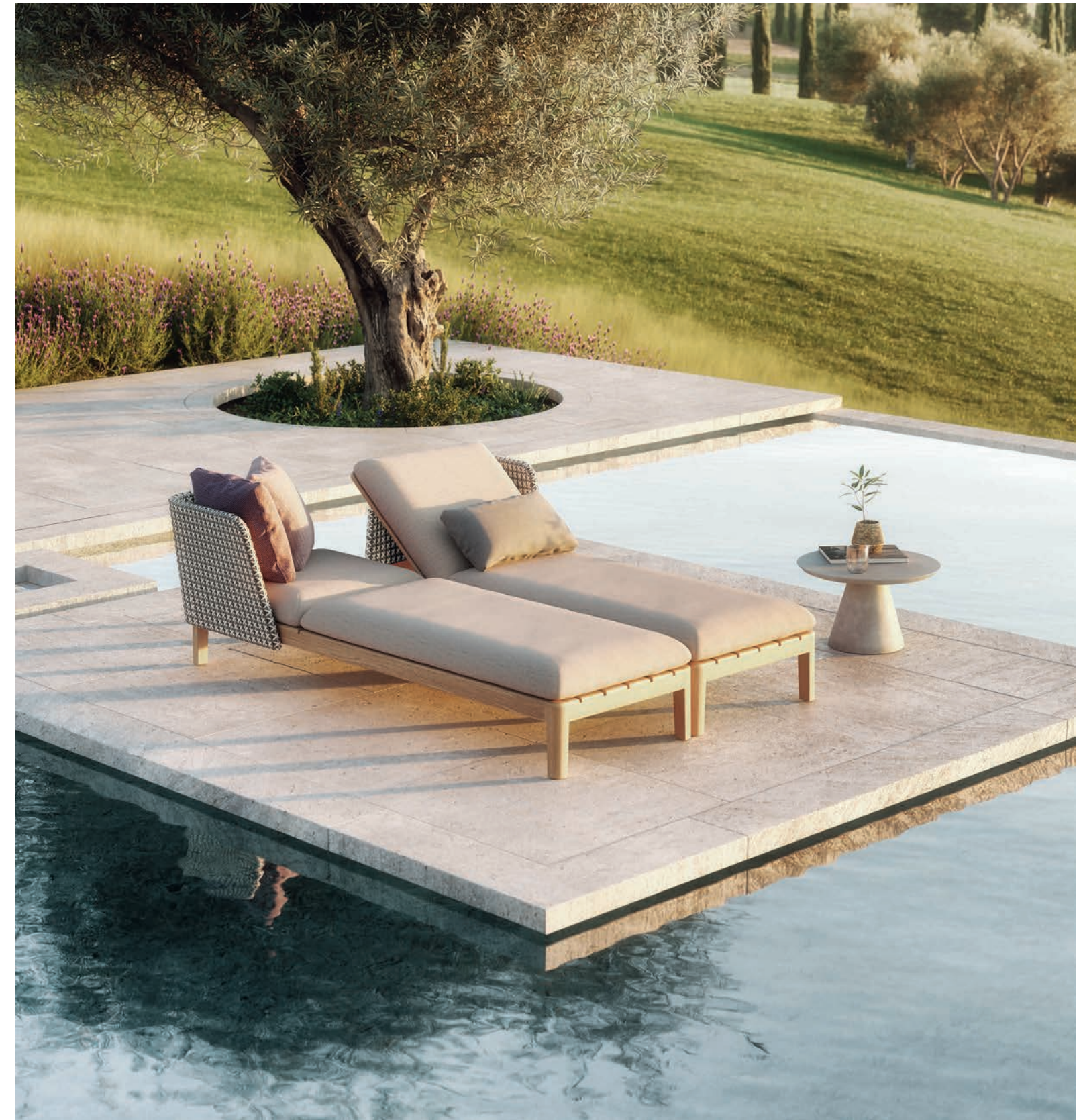
CALYPSO LOUNGE - CONIX 60T SIDE TABLE