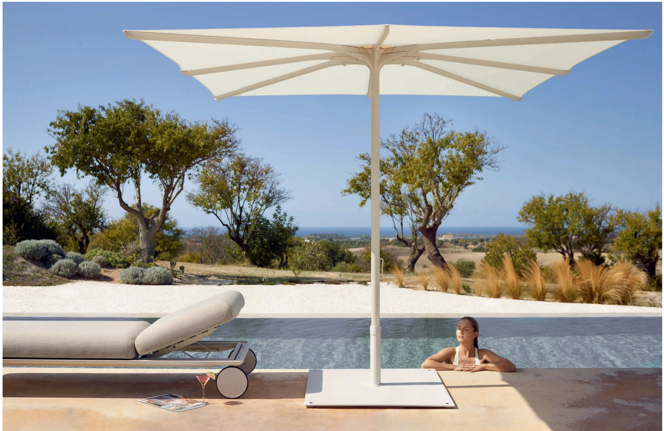
STYLETTO LOUNGE - BLOOM 275V PARASOL