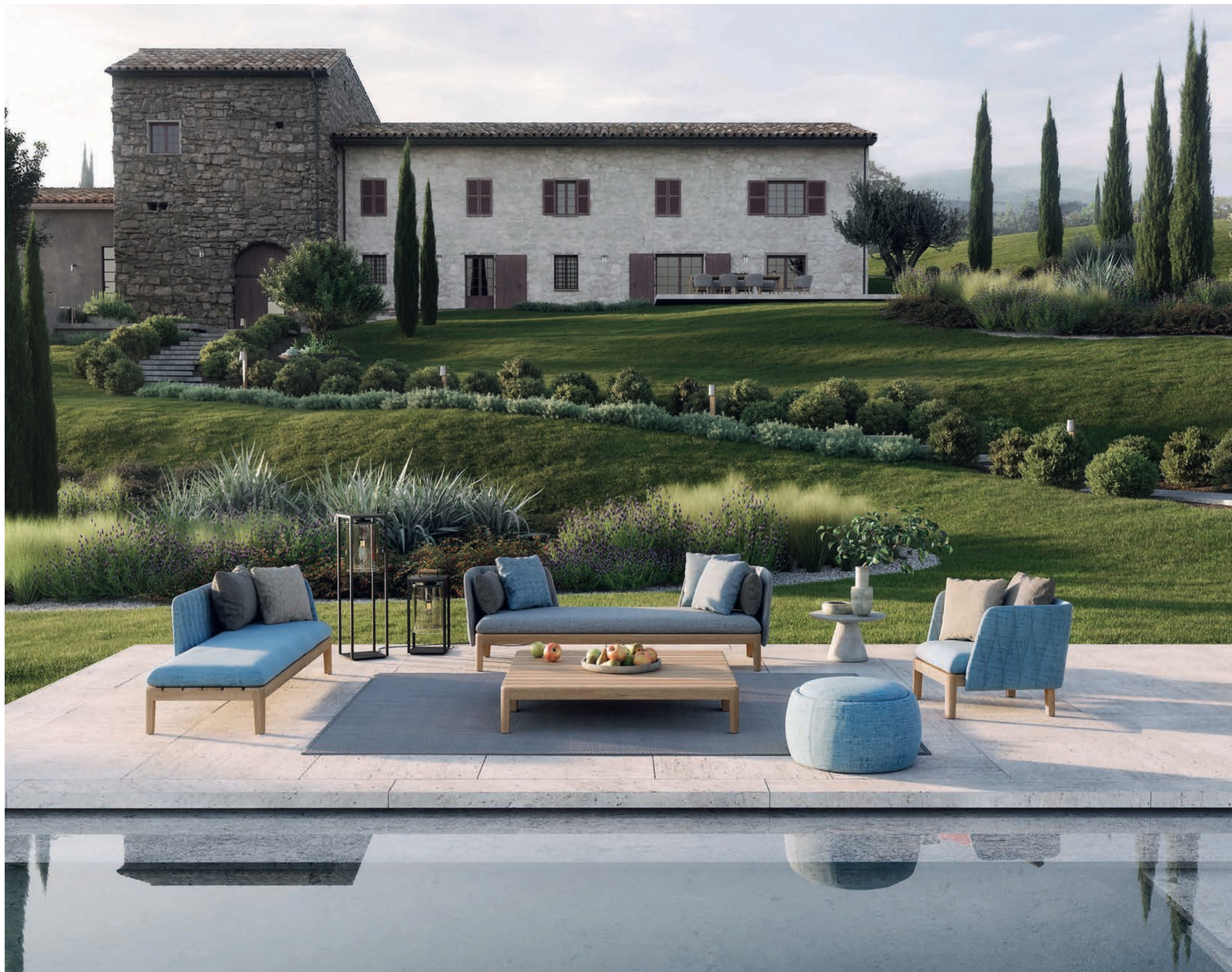
150 CALYPSO LOUNGE - TONO 70 POUF - CONIX 40TL SIDE TABLE - RUG 2535 - DOME LIGHTS