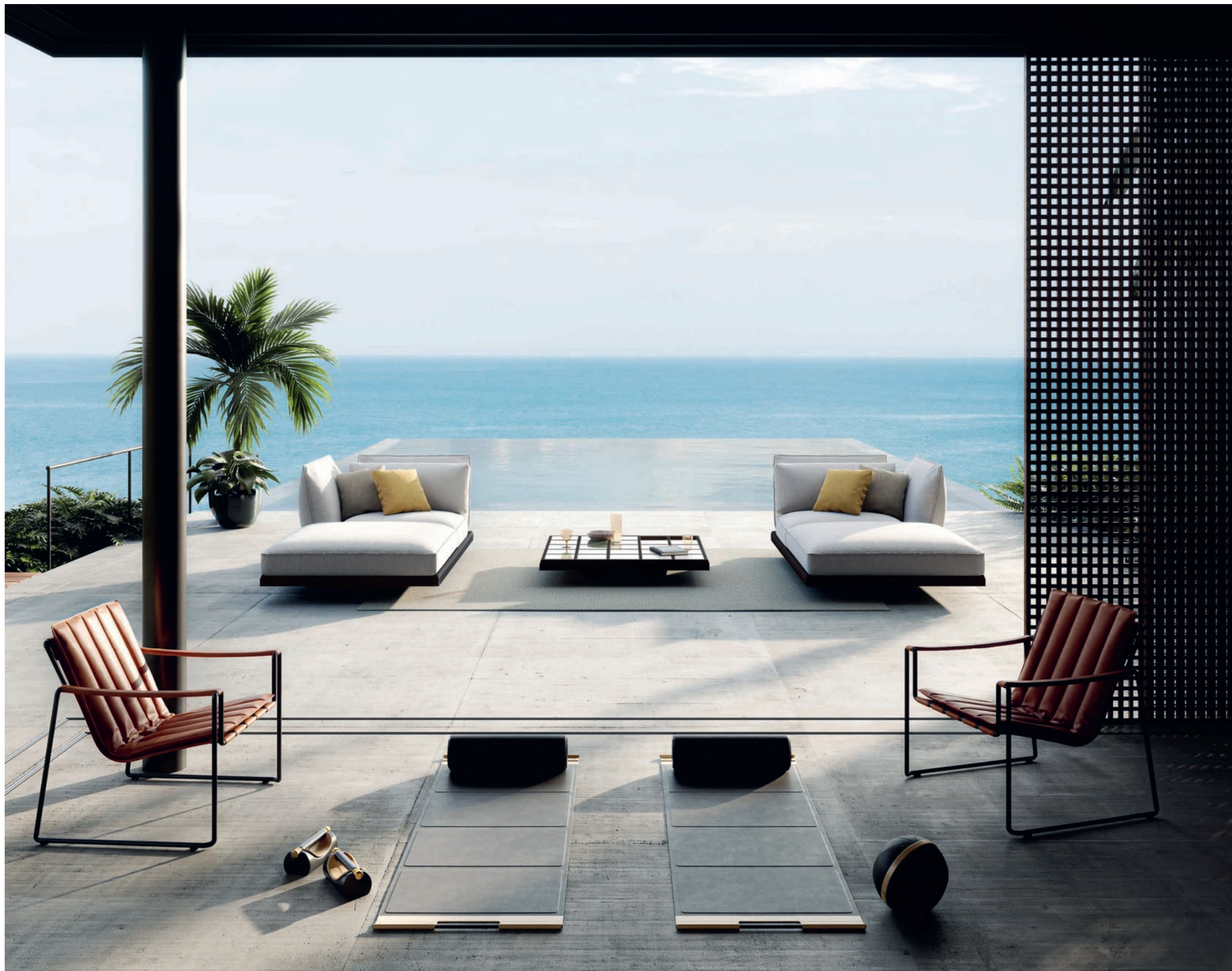
34 STRAPPY 77 LOW CHAIRS - MOZAIK LOUNGE - RUG 2543