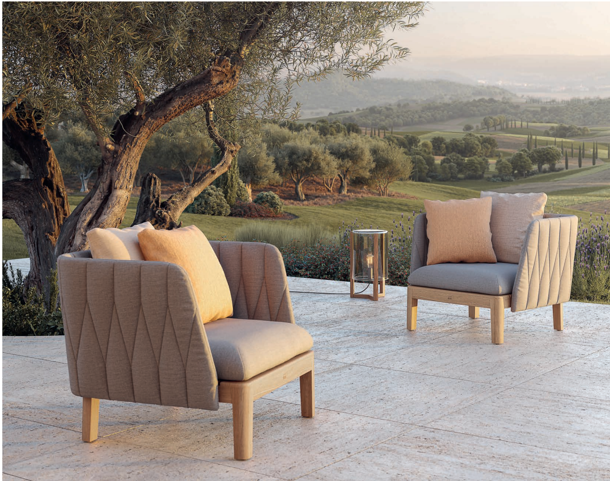
146 CALYPSO LOUNGE - TRISTAR LIGHT