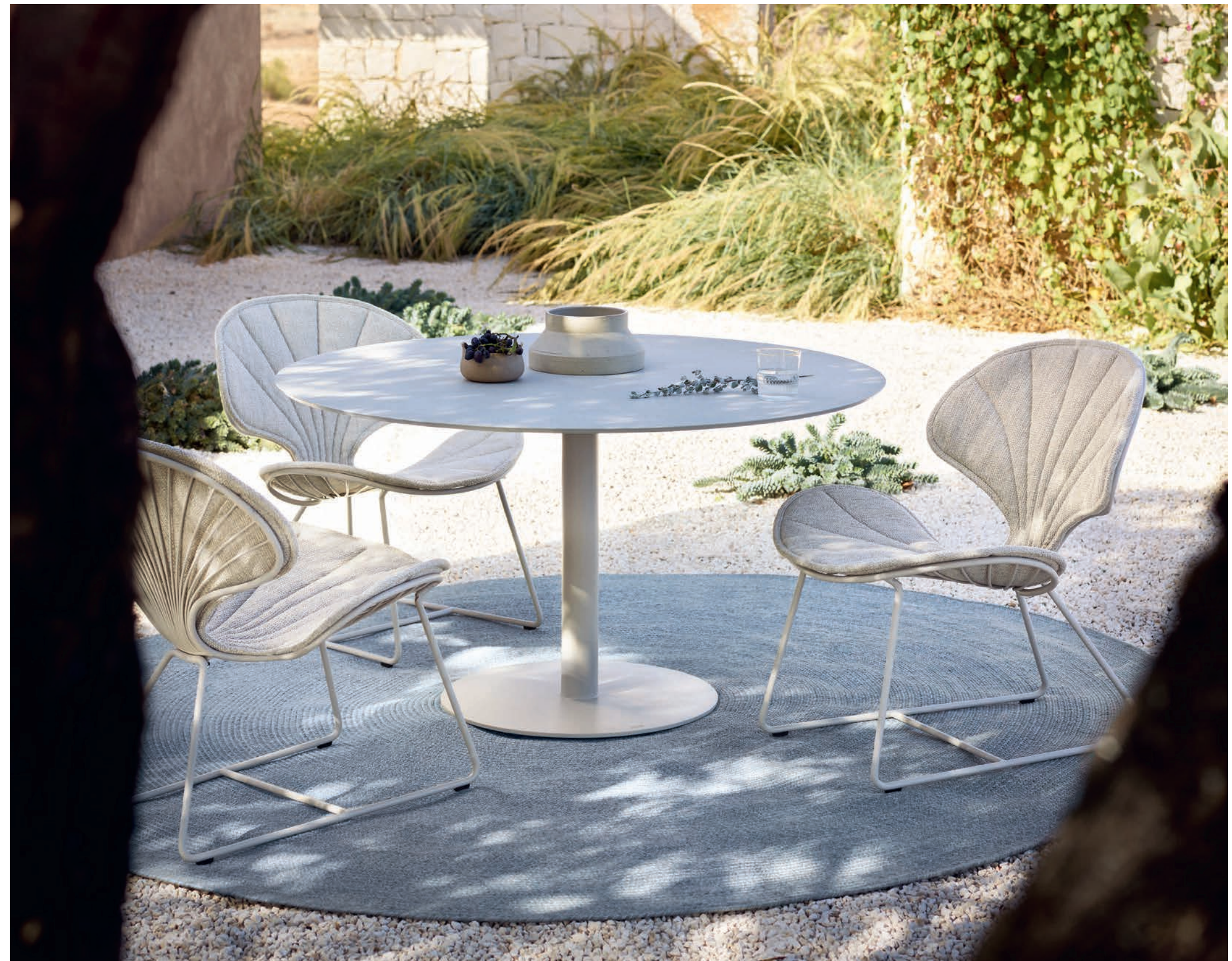
OSTREA 77 LOW CHAIRS - BUTLER 120 LOW DINING TABLE - RUG 240