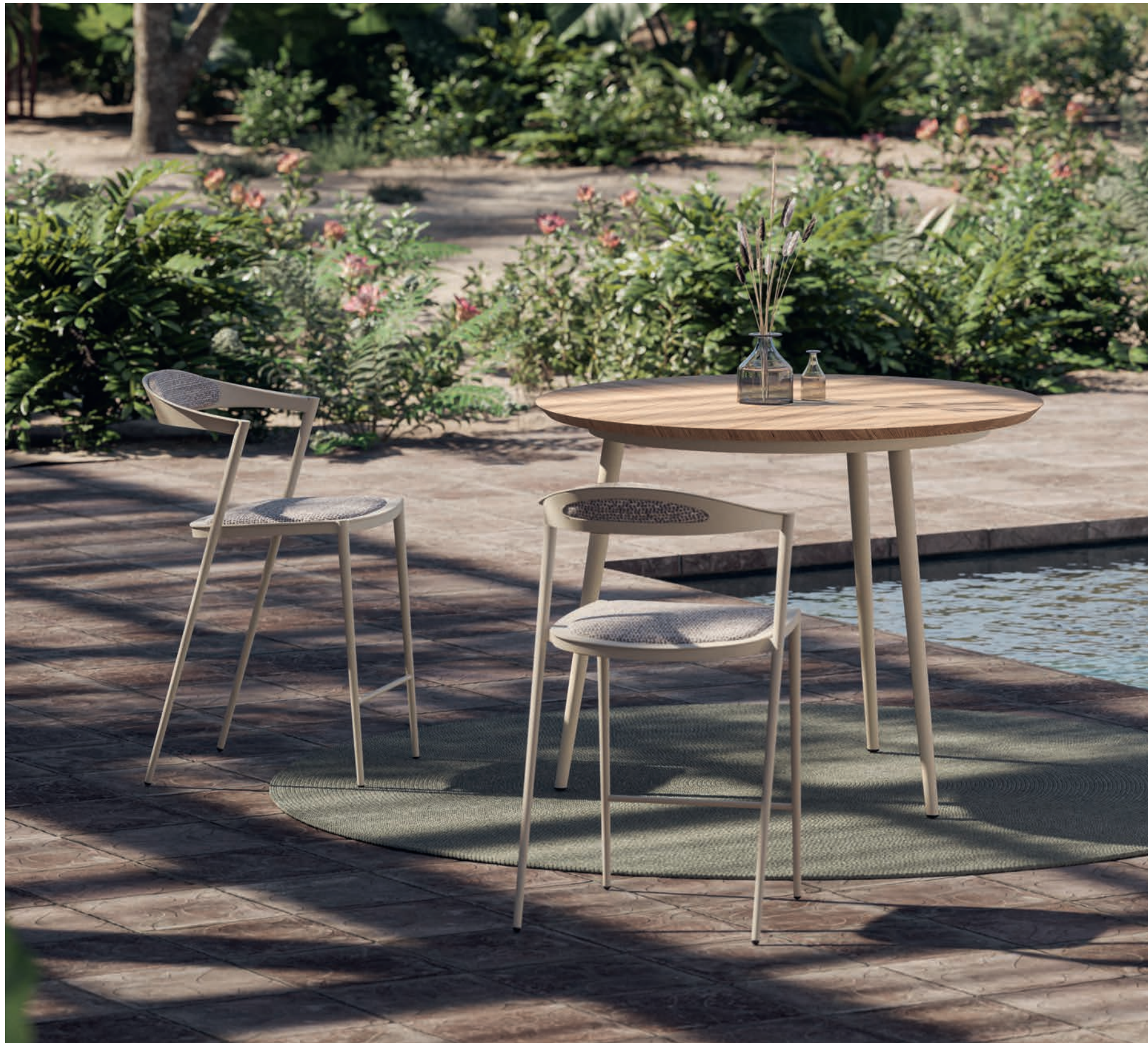
72 STYLETTO 120 COUNTER HEIGHT TABLE - STYLETTO 43CH BAR CHAIR - RUG 240