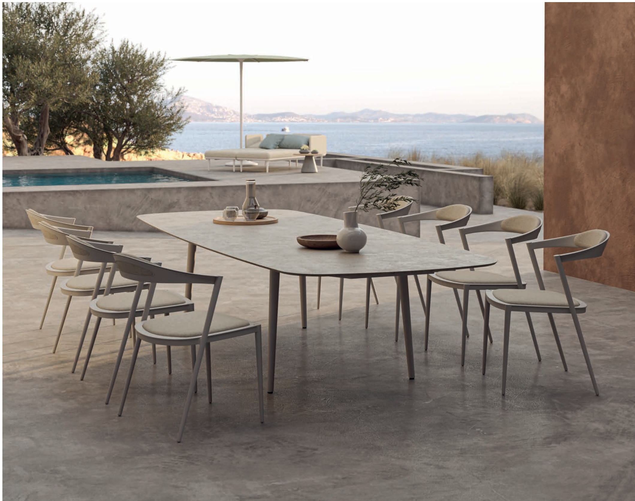
74 STYLETTO 55 DINING CHAIR & 300 DINING TABLE - STYLETTO LOUNGE - PALMA 300 PARASOL