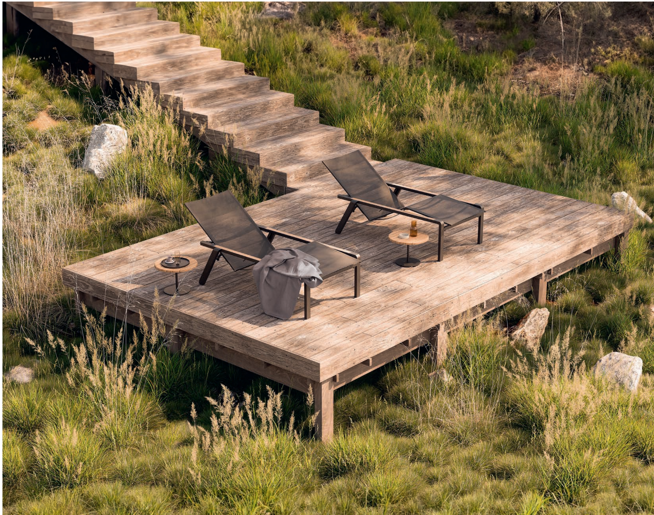
176 ALURA 195T LOUNGERS - BUTLER 40TL SIDE TABLES