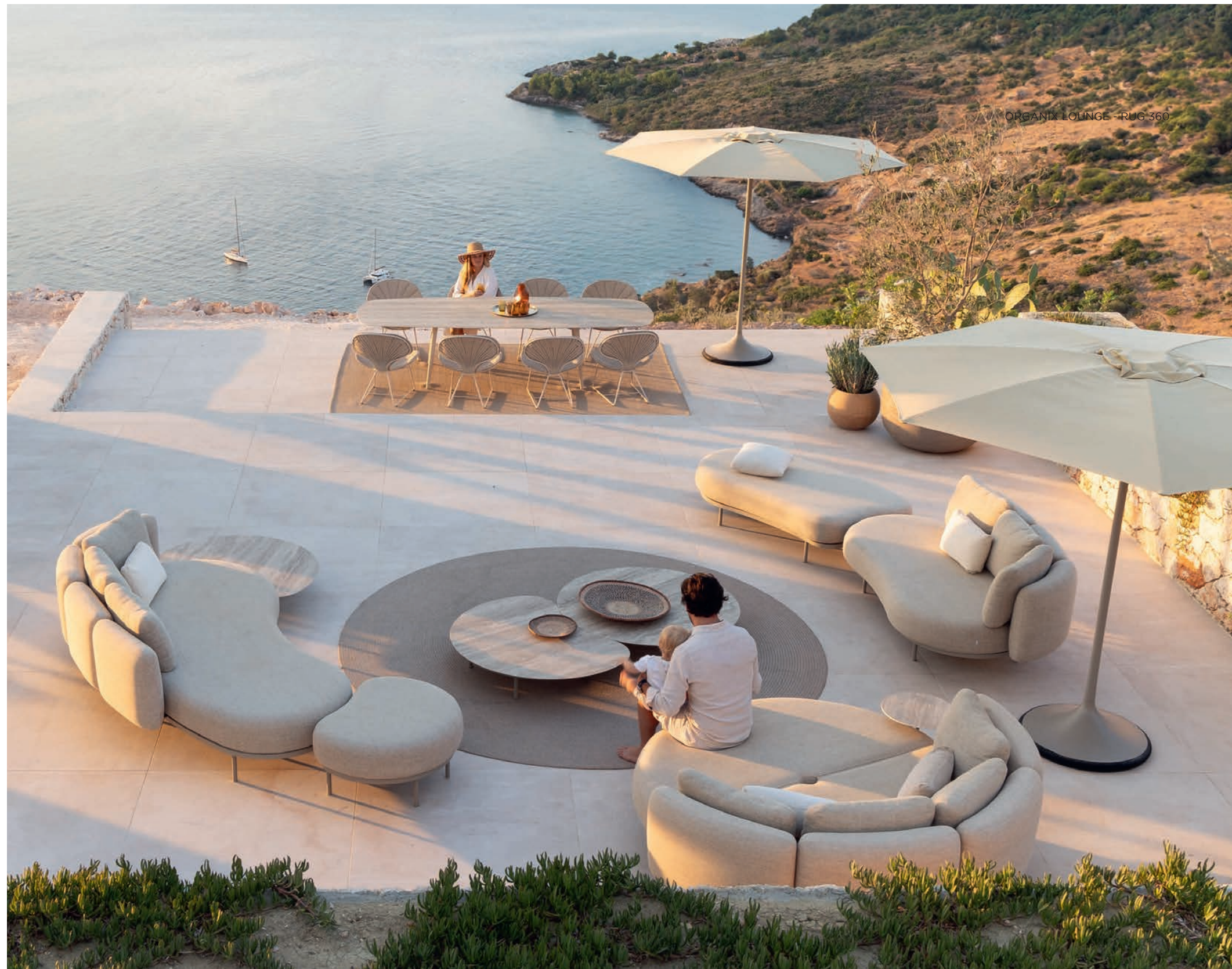
ORGANIX LOUNGE - RUG 360