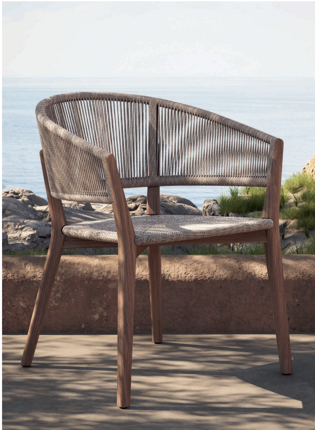
124 CARÉS 55 DINING CHAIR