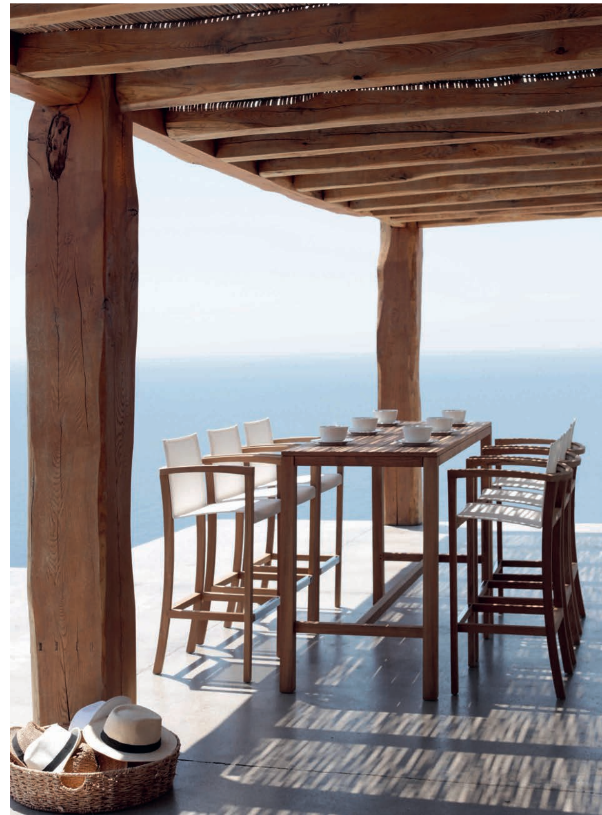
XQI 43 BAR CHAIRS - XQI 200H BAR TABLE