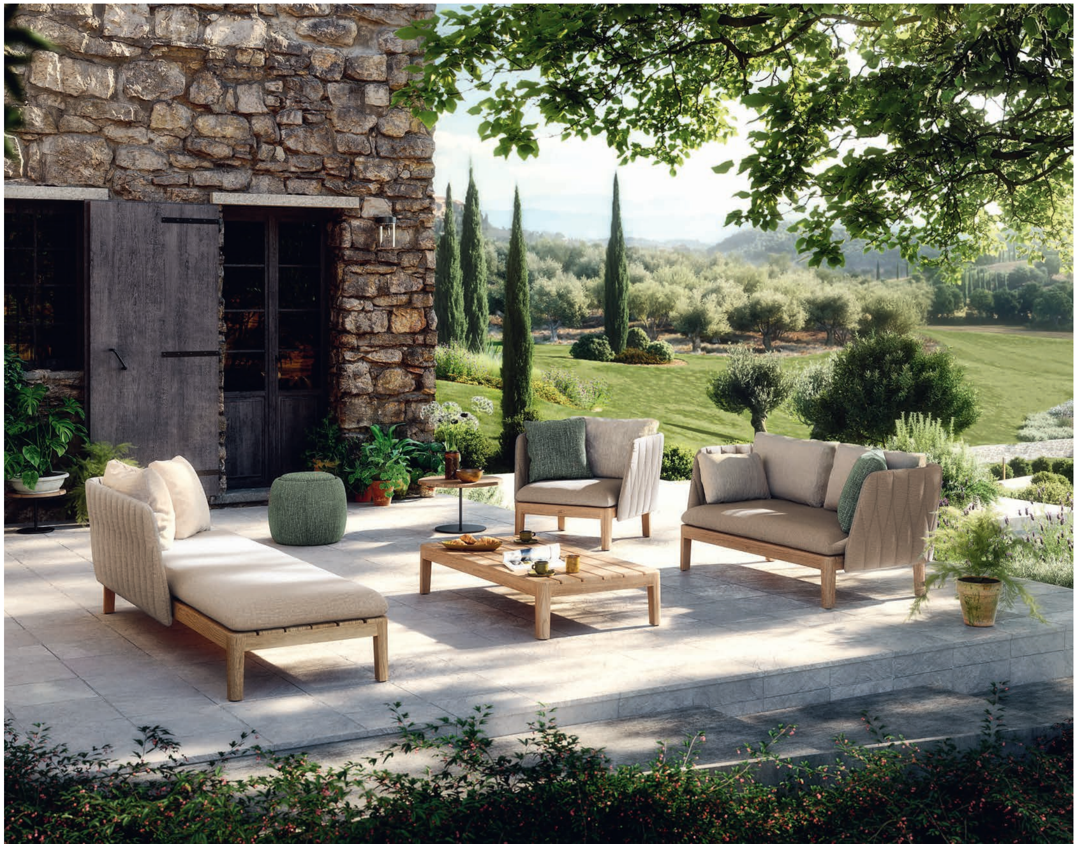
CALYPSO LOUNGE - TONO 50 POUF - BUTLER 40TL & 60T SIDE TABLES