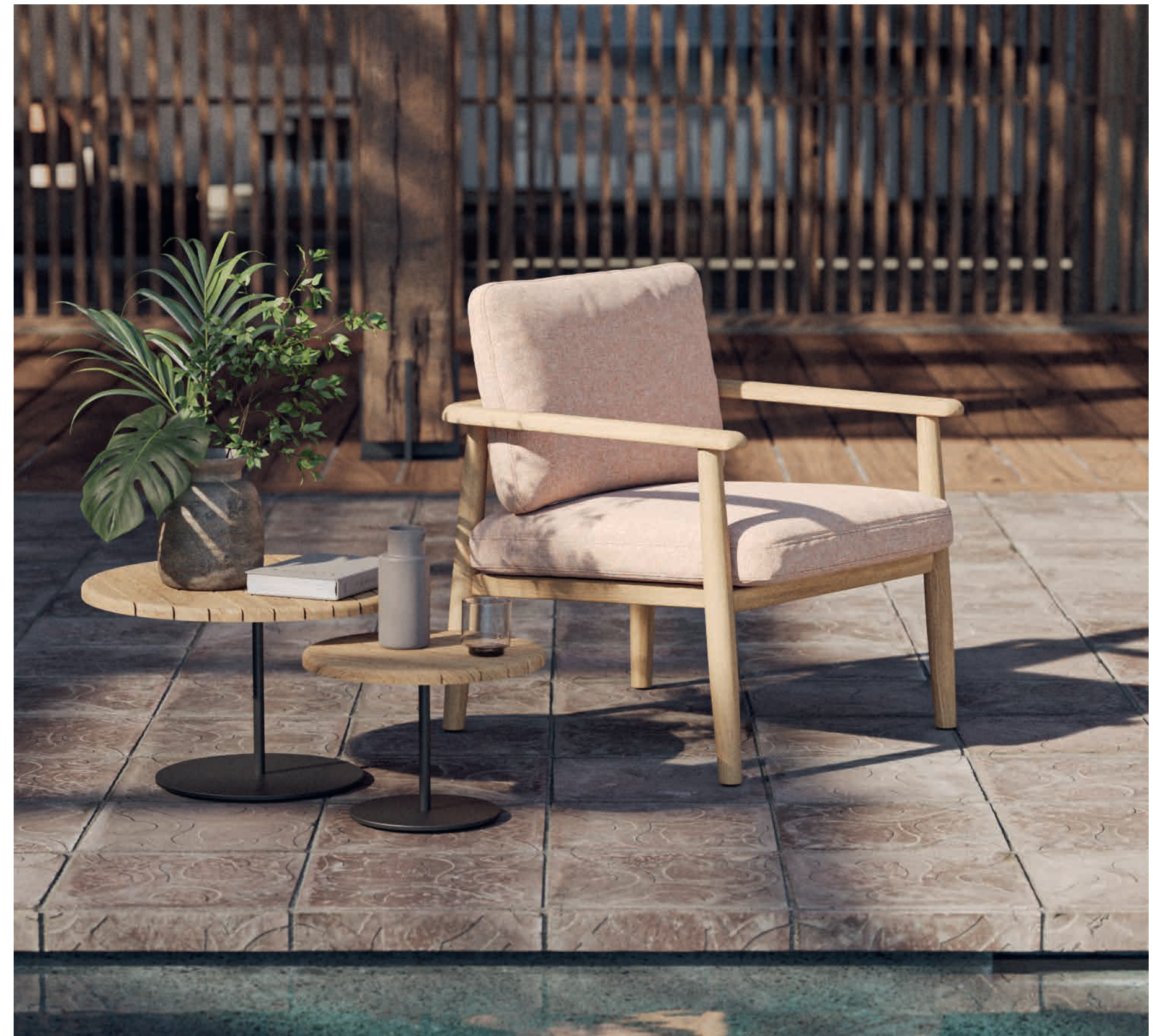
MAMBO 77 LOW CHAIR - BUTLER 40TL & 60T SIDE TABLES