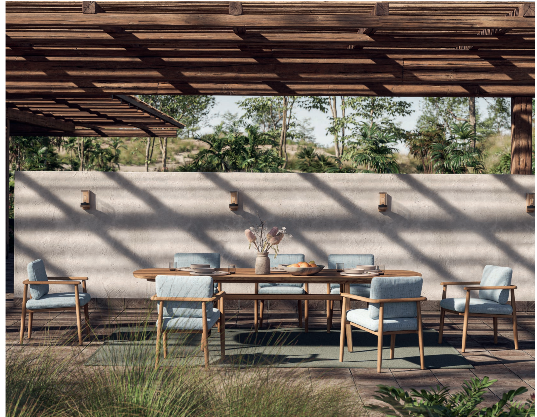
MAMBO 55 DINING CHAIRS - ZIDIZ 300 DINING TABLE - RUG 2535 - CLOCHE WALL LIGHTS