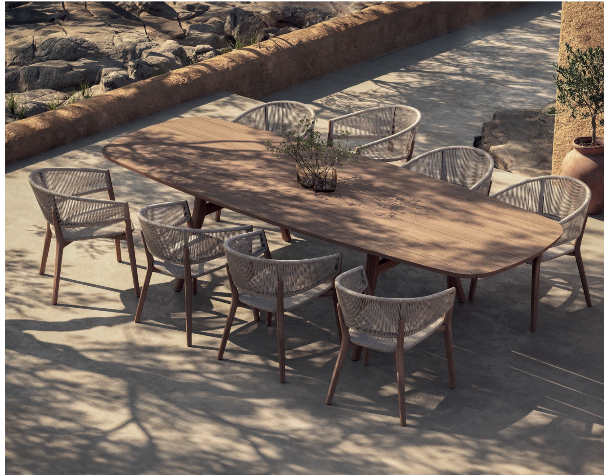
CARÉS 55 DINING CHAIRS - ZIDIZ 320 EXTENDABLE DINING TABLE