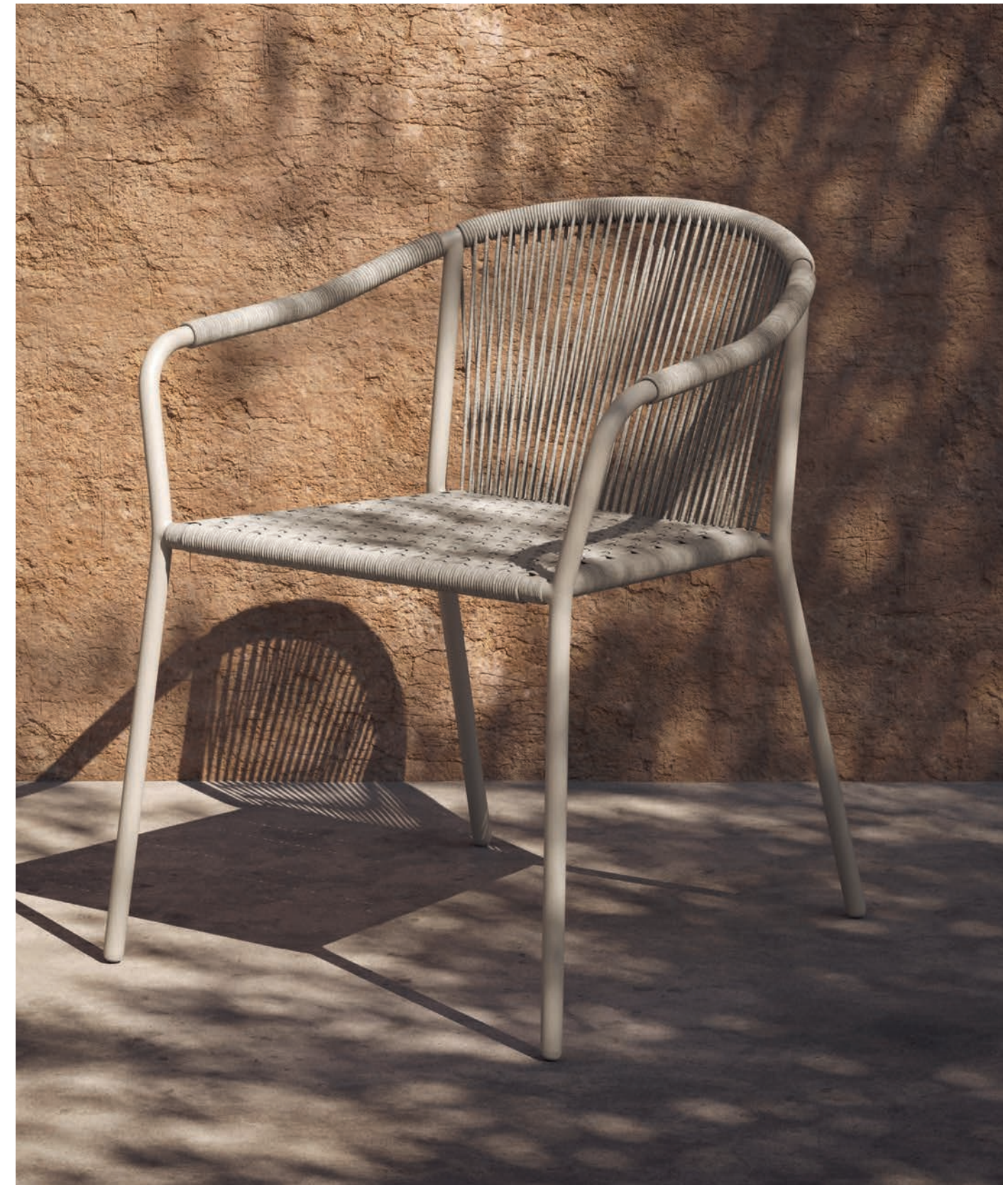
SAMBA 55 DINING CHAIR