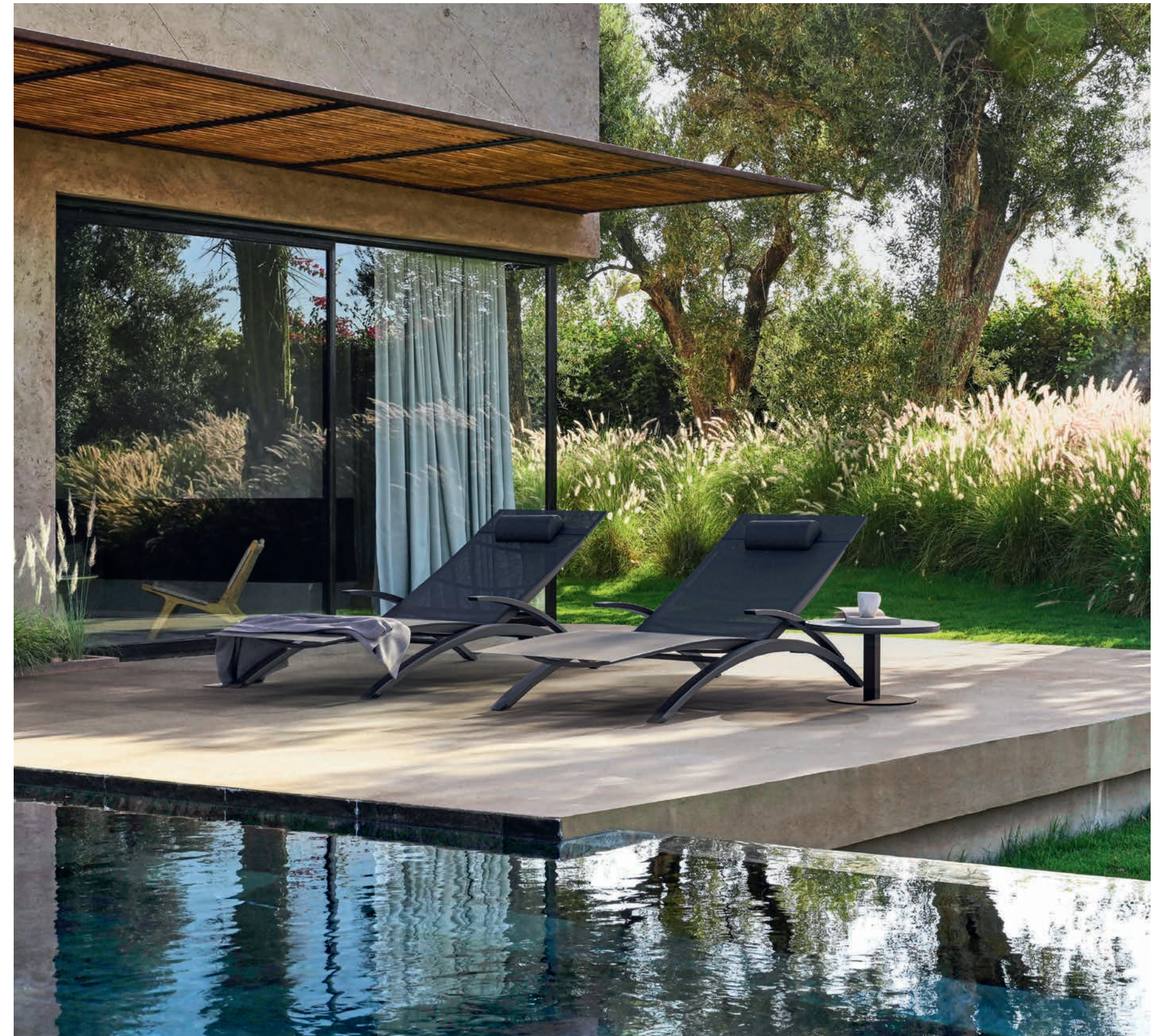
O-ZON 195T LOUNGERS & 50 SIDE TABLE