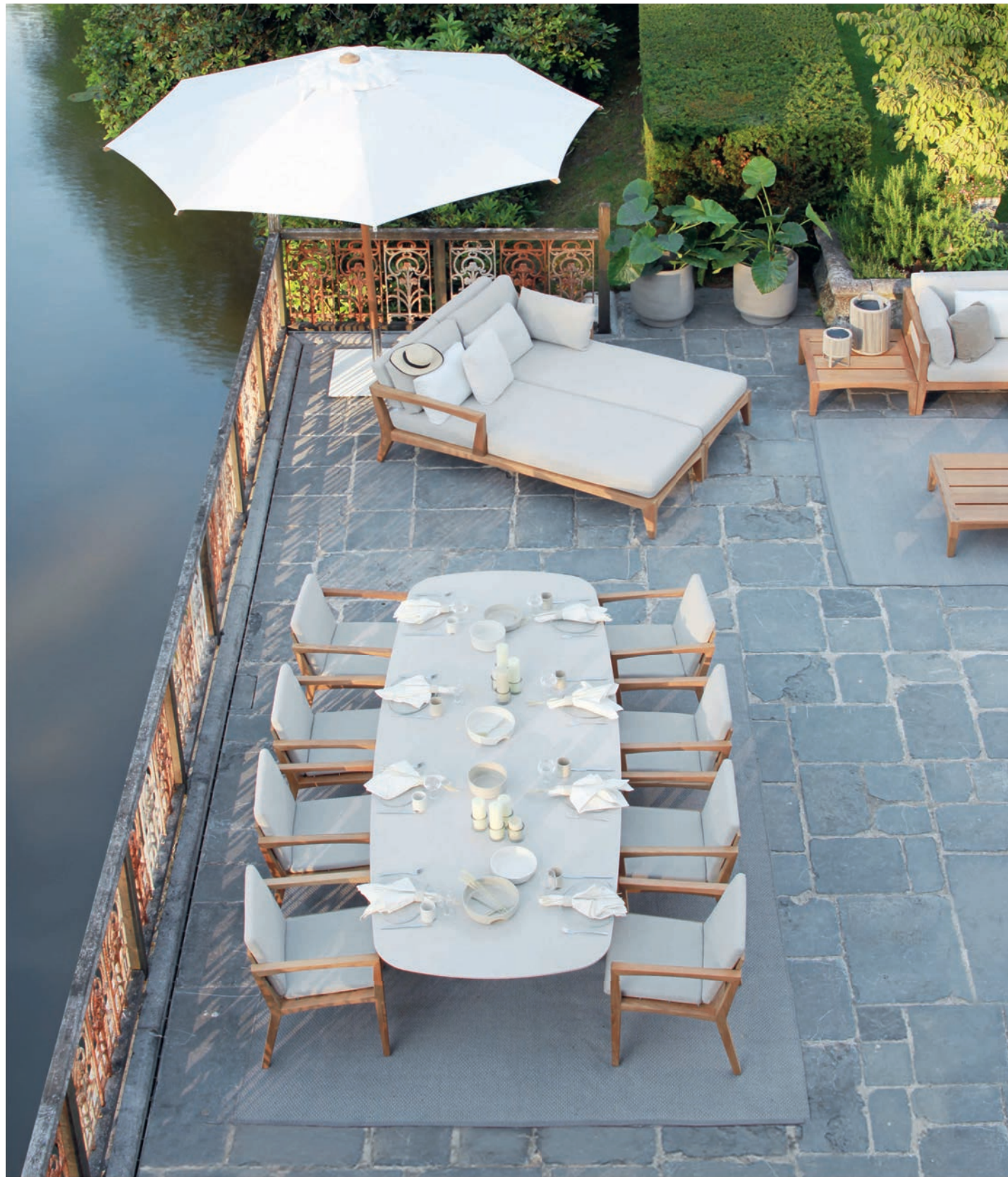
160 ZENHIT 55 DINING CHAIRS - ZIDIZ 300 DINING TABLE - ZENHIT LOUNGE - SHADY 35TK PARASOL - RUG 2535