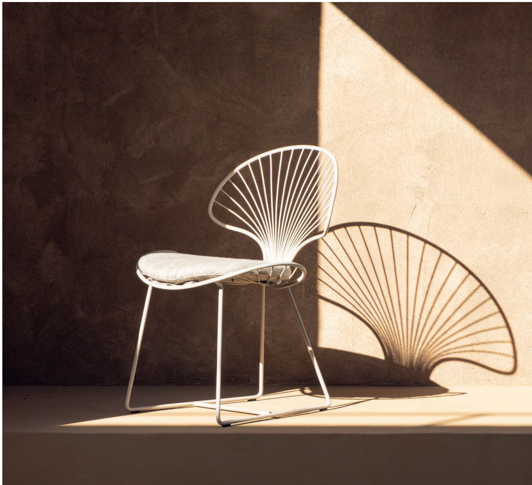
98 OSTREA 47 DINING CHAIR