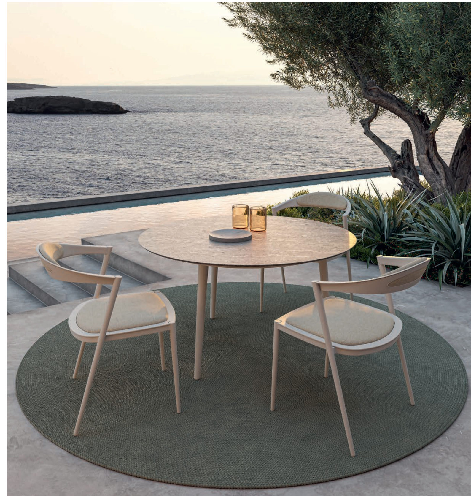
STYLETTO 55 DINING CHAIR - STYLETTO 120 DINING TABLE - RUG 240