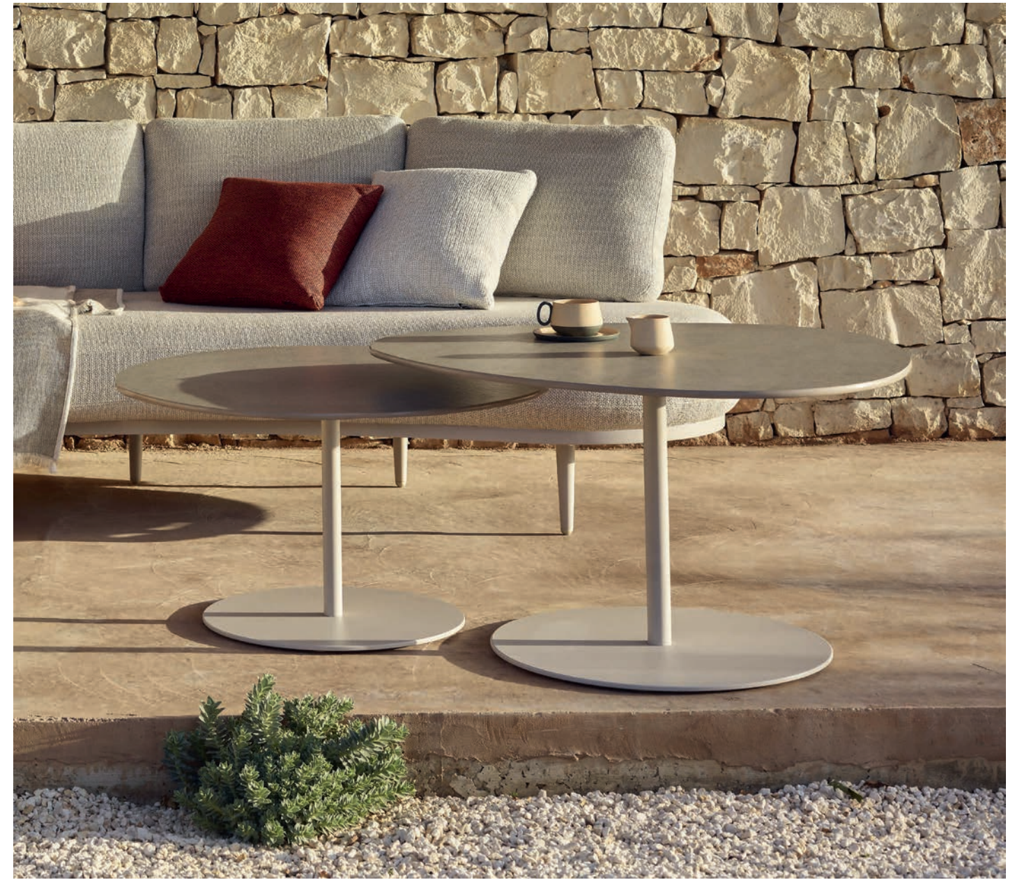
ORGANIX LOUNGE - BUTLER 60PLT & 40TL SIDE TABLES