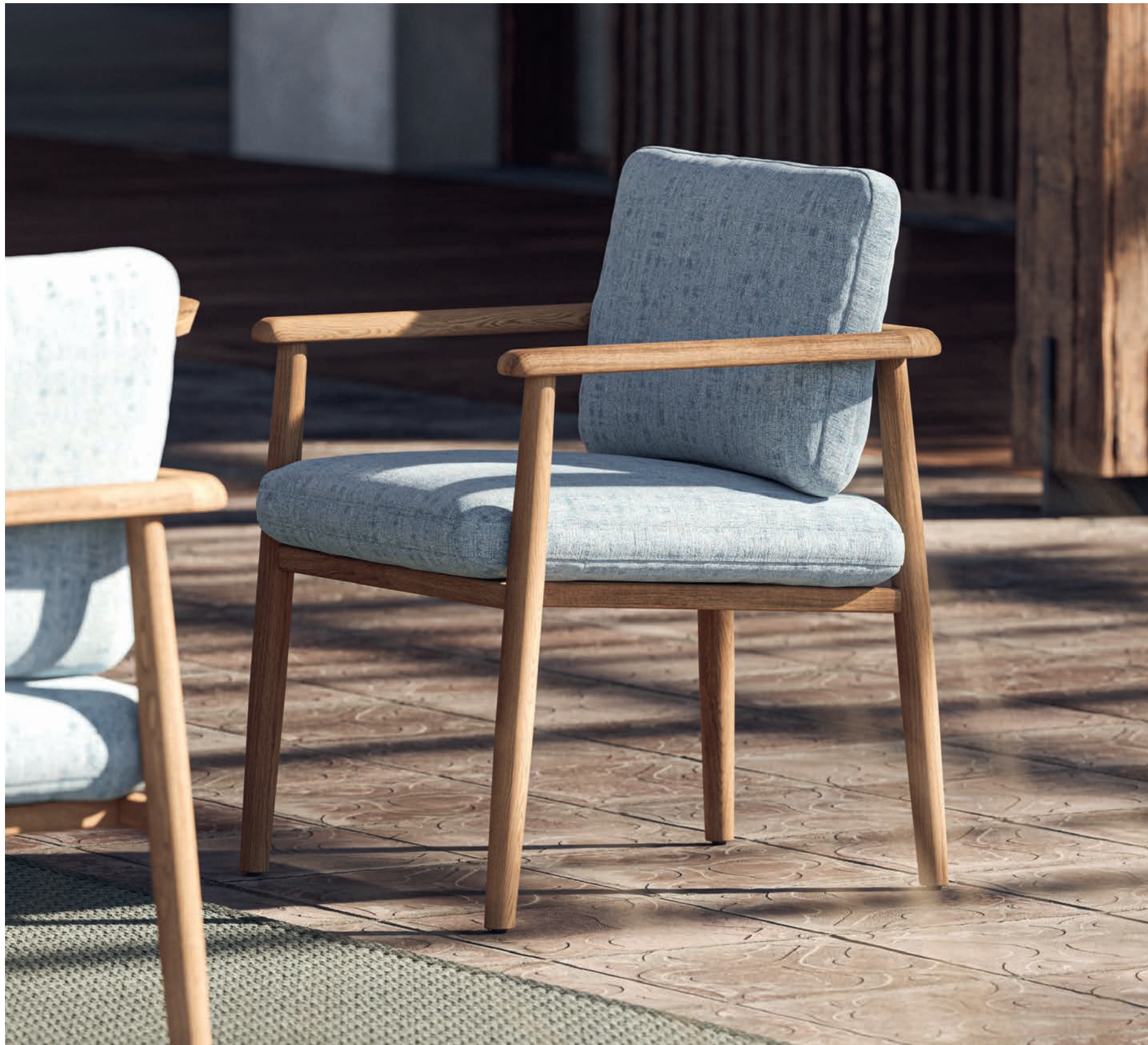
20 MAMBO 55 DINING CHAIR