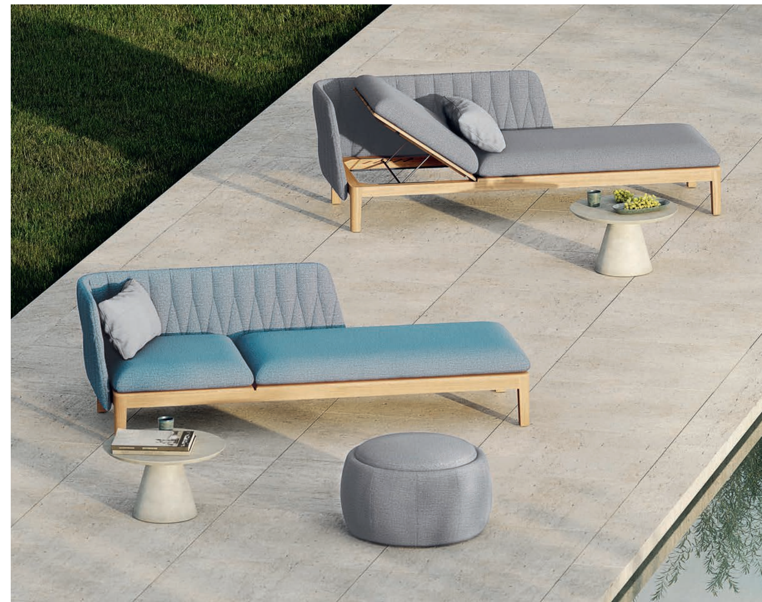
CALYPSO LOUNGE - TONO 70 POUF - CONIX 60T SIDE TABLES