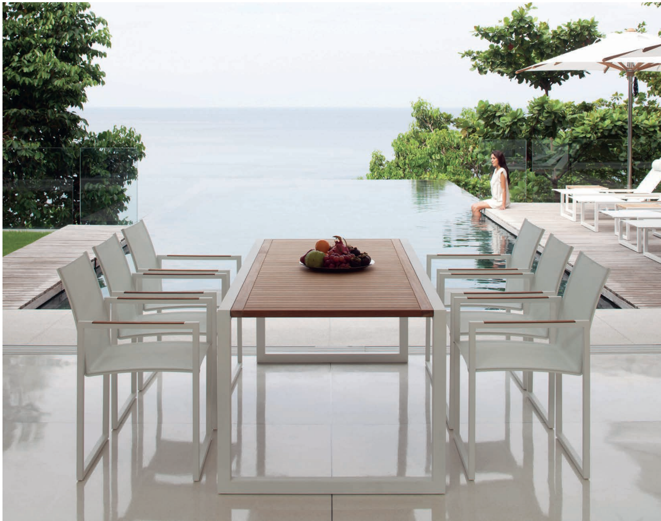
46 NINIX 55T DINING CHAIRS - NINIX 200 DINING TABLE