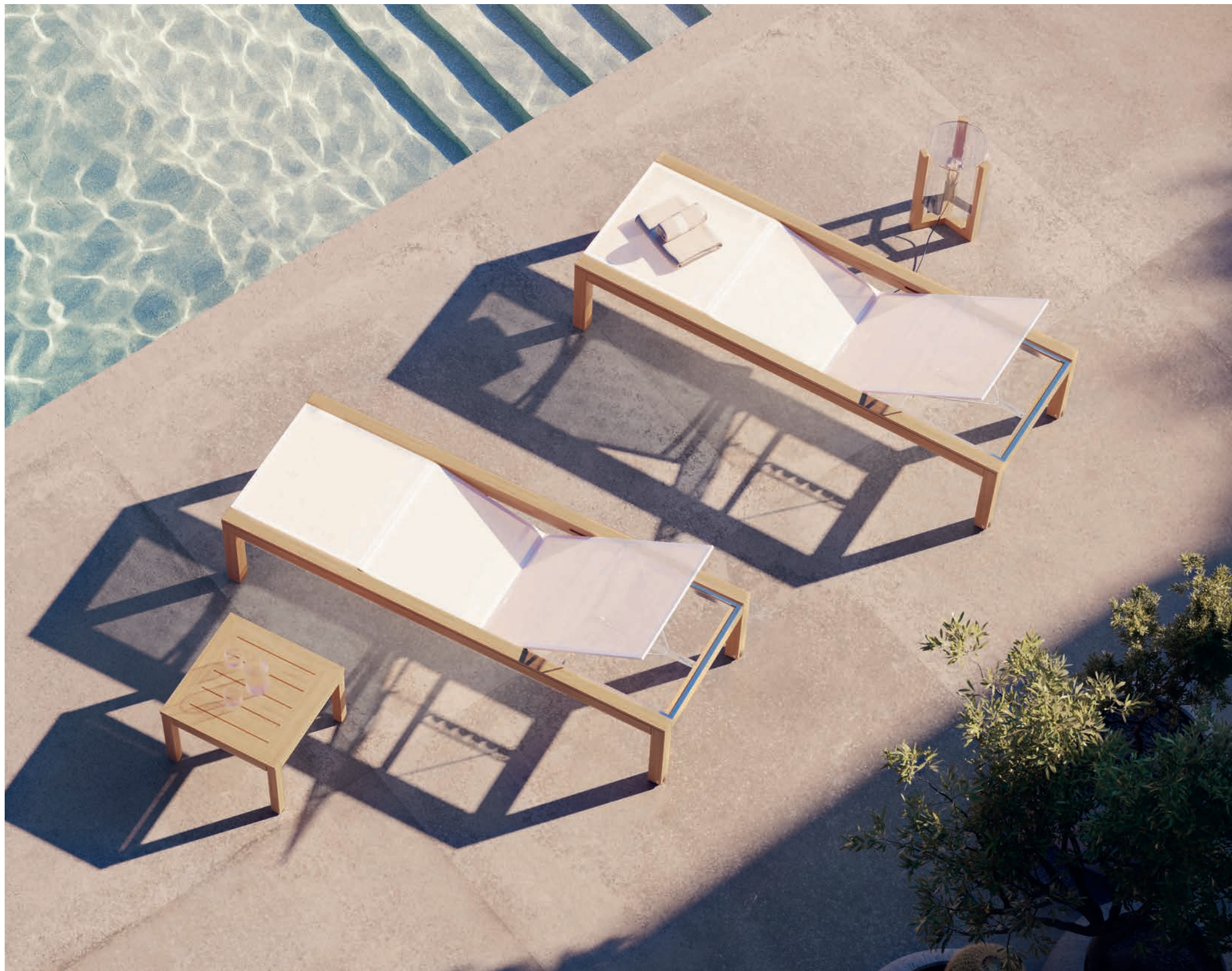
116 XQI 195 LOUNGERS - XQI 50 SIDE TABLE - TRISTAR LIGHT