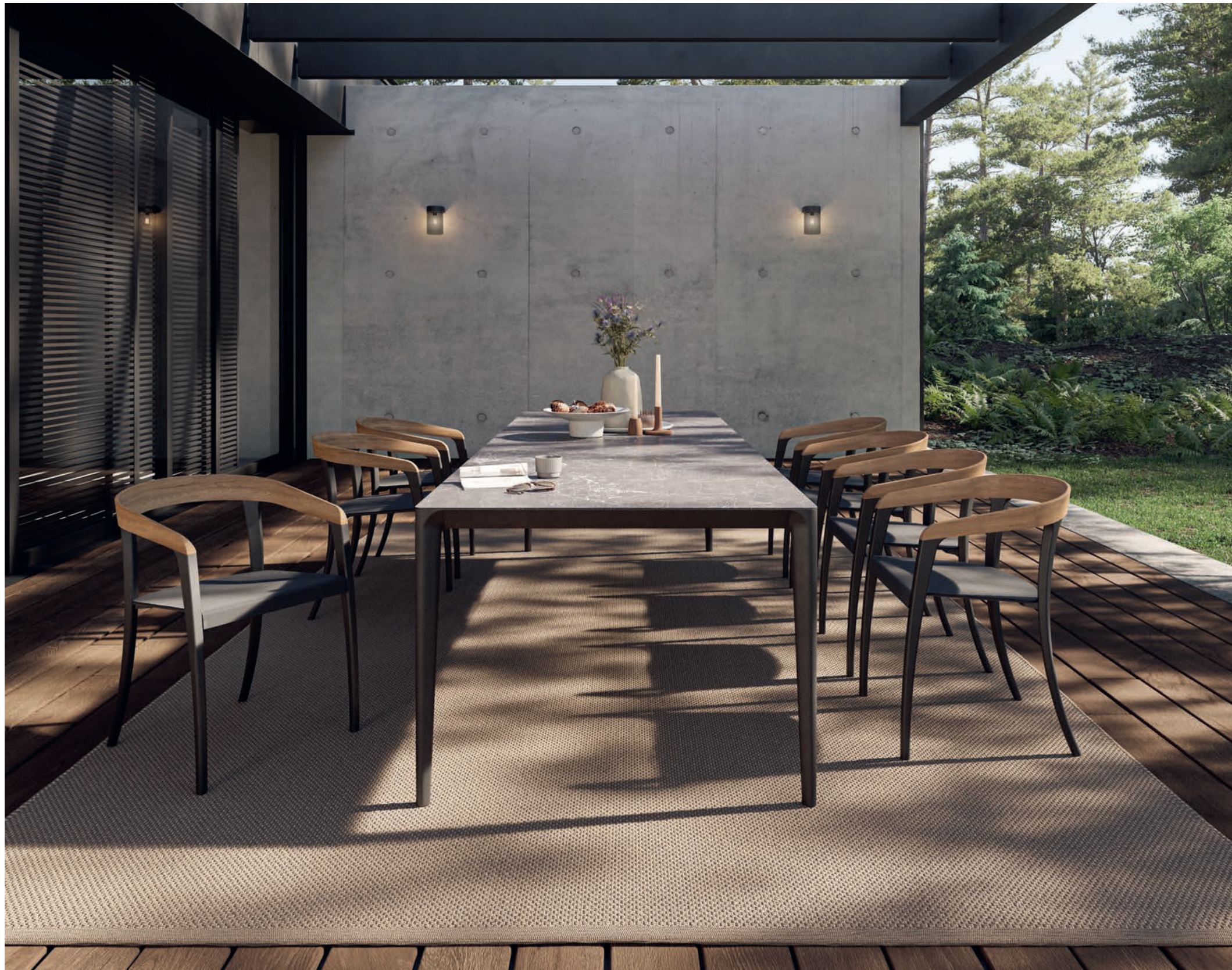
180 JIVE 55WT DINING CHAIRS - U-NITE 300 DINING TABLE - RUG 2543 - TESLA LIGHTS