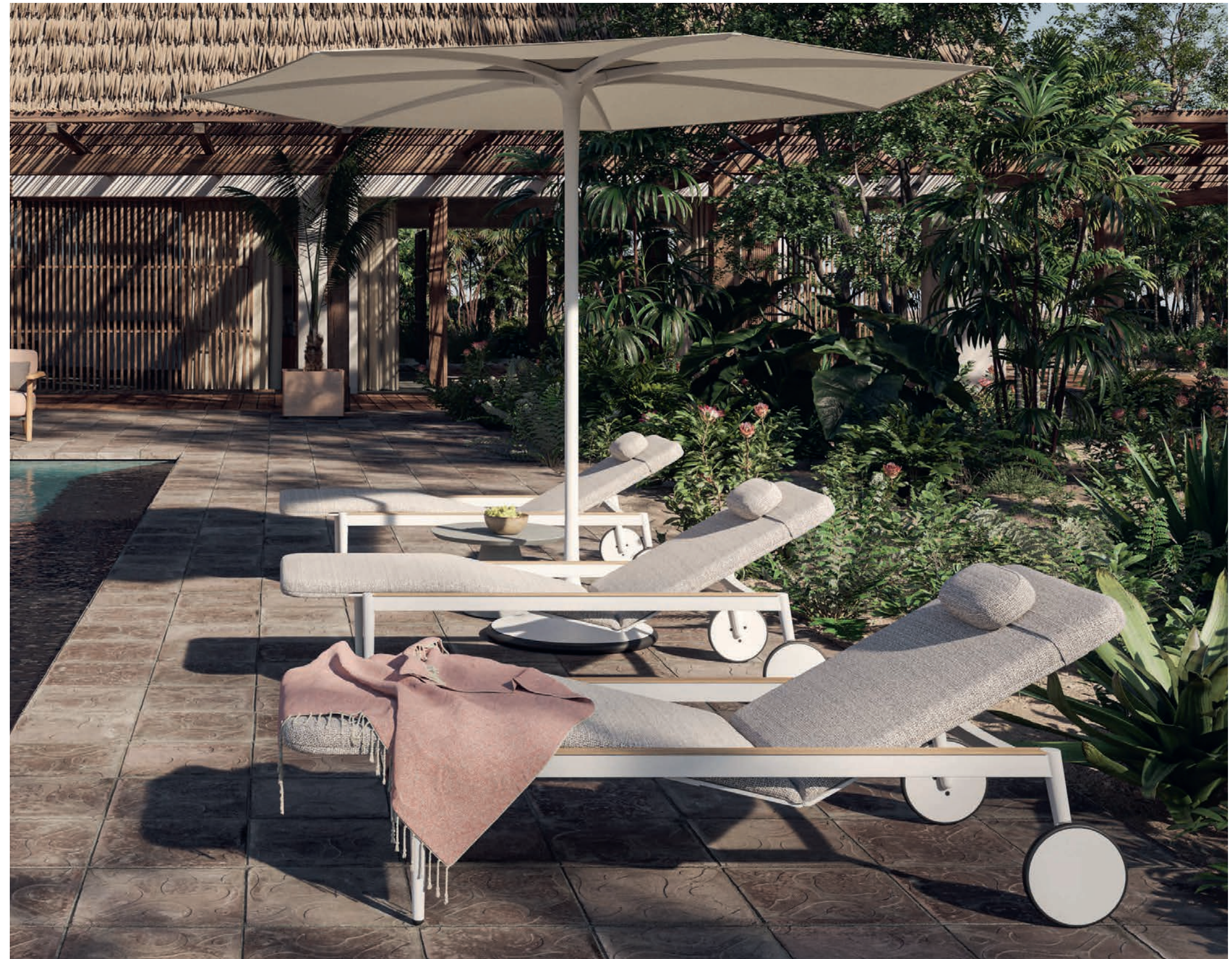
STYLETTO 195T LOUNGERS - PALMA 300 PARASOL