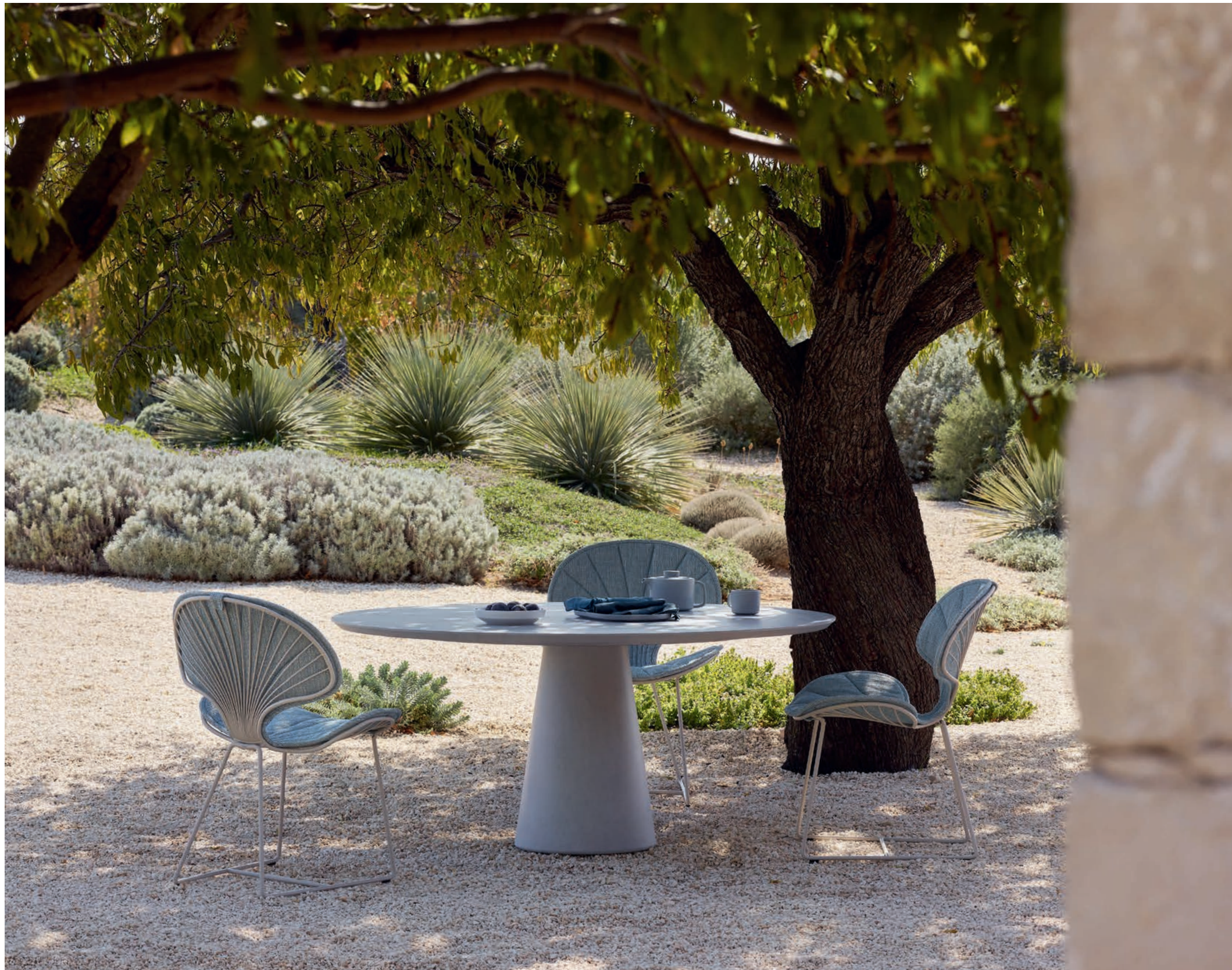
100 OSTREA 47 DINING CHAIRS - CONIX 160 DINING TABLE