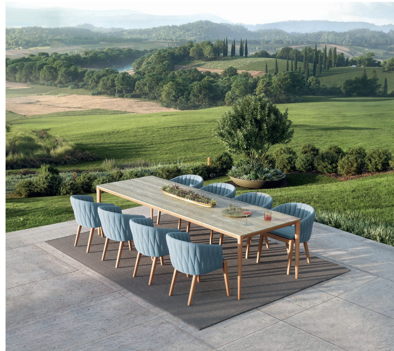
CALYPSO 55 DINING CHAIRS - U-NITE 300 DINING TABLE - RUG 2535